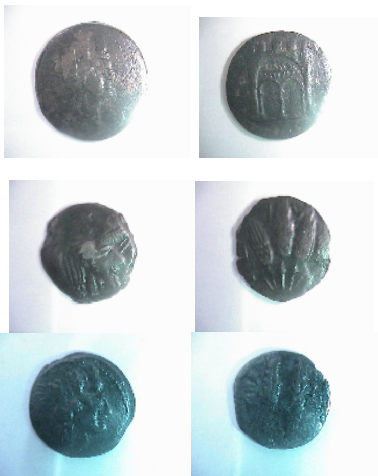
Monnaies anciennes d'Afrique du nord Planche n° III