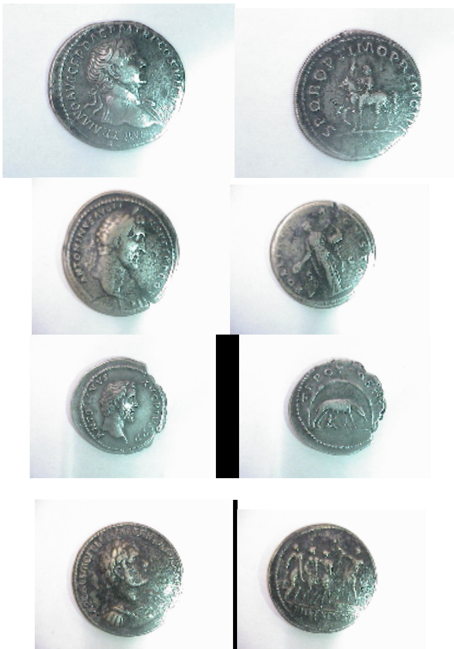
Monnaies Romaines. Haut-Empire Planche n° V