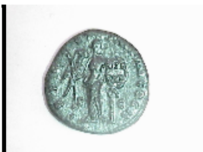
Monnaies Romaines. Haut-Empire Planche n° VI