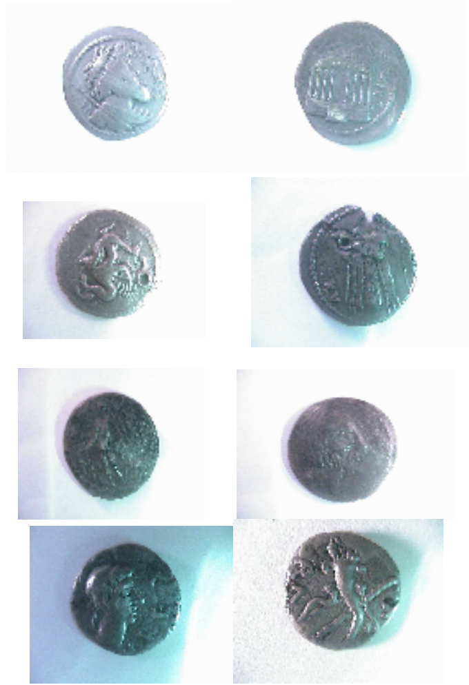
Monnaies anciennes d'Afrique du nord Planche n° II