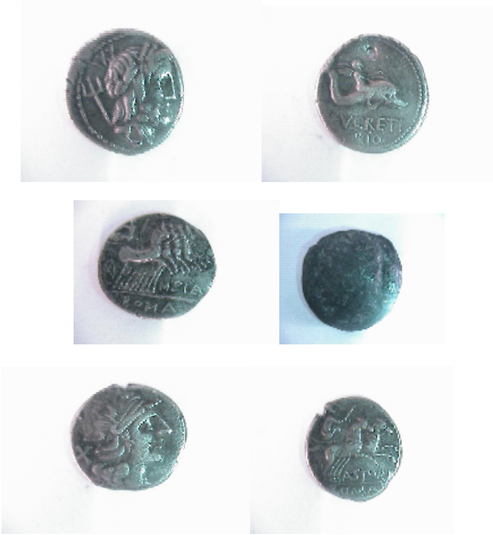
Monnaies Romaines. République Planche n° IV